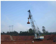
贵州龙里万科地基强夯工程