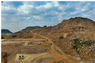
海纳川韩国现代汽车配套项目土石方工程