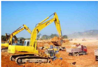
两江新区中联重科项目土石方工程