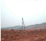
瑞丽铁路产土园地基强夯工程