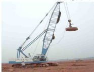
云阳金科地基强夯工程