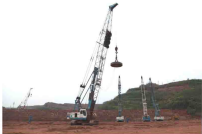
重庆机场三跑道地基强夯工程